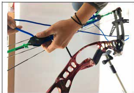
NR.5 RETOURNER LE CÂBLE (BLEU)