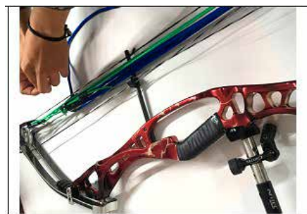
NR.2 RÉGLAGE DES CÂBLES