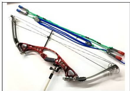
NR.1 POSITIONNEMENT (LA PARTIE BLEU DOIT ÊTRE AU DESSUS)