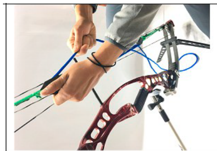
NR.4 TIRER LE CÂBLE (BLEU)