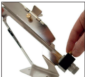
1. Desserrer la vis de fixation.

L'empenneuse est réglé pour monter 3 plumes pour classique. Il peut facilement être tourné à 90° pour une utilisation compound en suivant ces étapes: