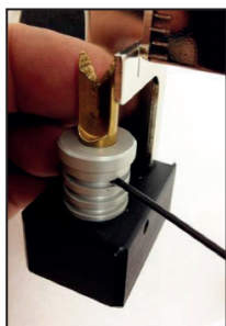
4. Faites pivoter le boitier pour l'encoche de 90°, en l'alignant avec la ligne de référence et fixer le grain. Maintenant le bloc est prêt pour monter les plumes compound.

L'impenneuse est réglé pour monter 3 plumes. Vous pouvez modifier facilement pour monter 4 ou 6 plumes en suivant ces étapes: