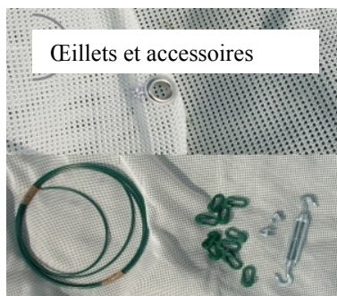
Oeilletons et accessoires

Nous vous conseillons de prévoir une longueur 15% supérieure à celle à protéger, de manière à poser le filet froncé pour une efficacité et un arrêt des flèches optimale.